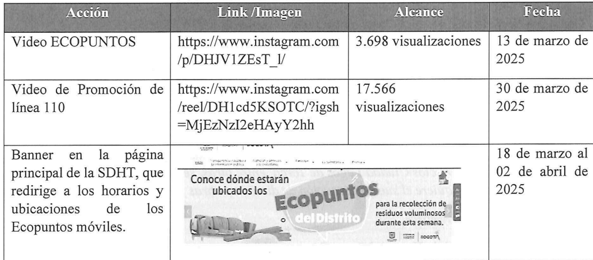
Tabla No. 1

Promoción de los Ecopuntos como una estrategia le permite a la ciudadanía recolectar y transportar gratis los Residuos de Construcción y Demolición (RCD) y/o voluminosos, contribuyendo en gran medida a disminuir el impacto negativo de su acumulación indiscriminada en el espacio público.